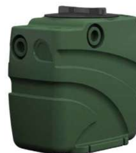
FEKA BOX 110