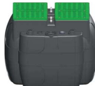
DELTA BOX 600

As centrais elevatórias de esgotos / drenagem são uma solução compacta e de fácil instalação. São a solução ideal quando as águas residuais, águas pluviais e águas sujas em geral têm de ser enviadas para coletores de esgoto localizados a uma cota superior ou quando não é possível a drenagem por gravidade. São constituídas por um tanque para 1 bomba (110, 200 e 214 lts) ou 2 bombas (430 ou 600 lts), por pés de acoplamento rápido com ligação roscada e guias para remoção das bombas na versão de 200 e 600 lts e por ligações no modelo 110 lts. Nos modelos Delta box 214 e 430, a pedido, poderão ser fornecidos com pés de acoplamento.