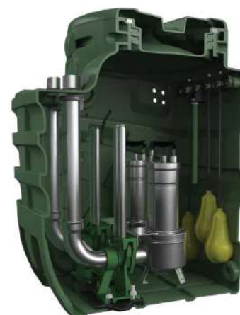
OUTROS MODELOS E SOLUÇÕES SOB CONSULTA